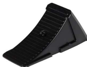
Cale de roue remorque