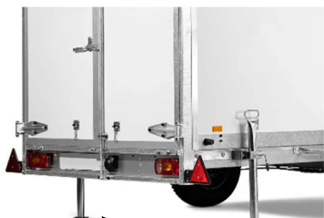
Kit béquilles arrière