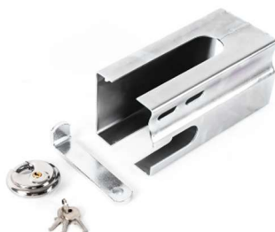
Boitier antivol cadenas rond

Pour toutes autres options nous consulter.