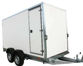
Porte latérale 185 cm