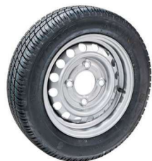
Roue de secours