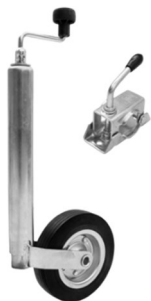
Kit roue jockey diam. 48

Pour toutes autres options nous consulter.