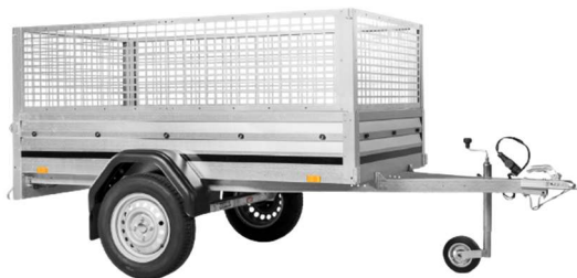
Rehausse grillagée 50cm