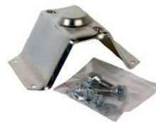
Support roue de secours